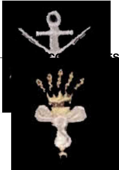
COMANDO EN JEFE